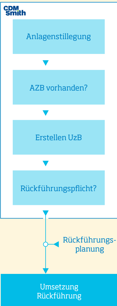
Ablauf der Anlagenstilllegung

Diesen Zustand des Anlagengrundstücks muss der Betreiber den Behörden in den Unterlagen zur Betriebseinstellung (UzB) darlegen. Zu prüfen sind dabei alle relevanten gefährlichen Stoffe, die im Ausgangszustandsbericht dokumentiert sind.